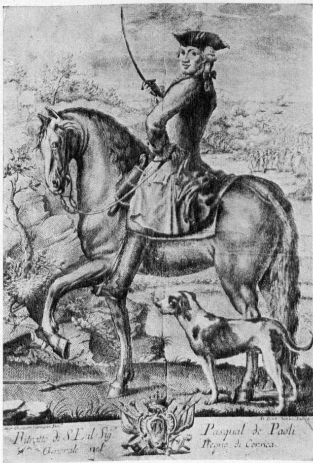
P. Paoli au début de son généralat d'après une lithographie de Louis GUIDOTTI