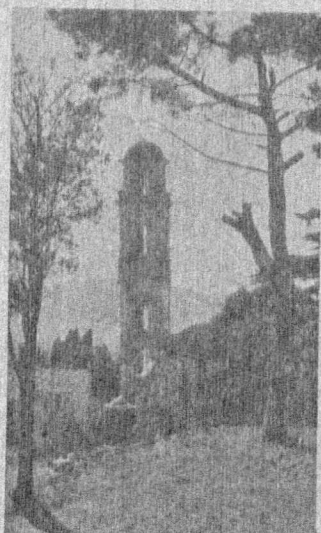
Campanile de Corbara

Souscrivez de suite chez votre libraire ou aux EDITIONS G.-L. ARLAUD 3, place Meissonnier — LYON