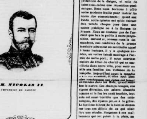
N. N. NICOLAS II EMPEREUR DE RUSSIE

Le Couronnement du Tsar C'est aujourd'hui qu'a lieu le couronnement du Tsar. Comme l'a si bien dit la presse parisienne, c'est une fête française. A ce titre, nous regardons comme un devoir de nous asso- cier à la joie de la Nation Russe, et nous prions Sa Ma- jesté le Tsar et son Auguste Compagne d'agréer l'expression de nos vœux pour leur prospérité et celle de la Russie. Du adversaire de la Russie!