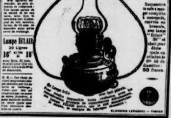
Lampe éclairé 30 Lignes

Le système de la lampe éclairé 30 lignes est le plus économique et le plus sûr. Elle brûle avec une consommation de gaz de 50 litres à 1 franc. Elle est facile à installer et à entretenir. Elle est recommandée par les experts et les ingénieurs. Elle est le meilleur système de chauffage et d'éclairage pour les habitations. Elle est le plus sûr et le plus économique des systèmes de chauffage et d'éclairage. Elle est le meilleur système de chauffage et d'éclairage pour les habitations. Elle est le plus sûr et le plus économique des systèmes de chauffage et d'éclairage.