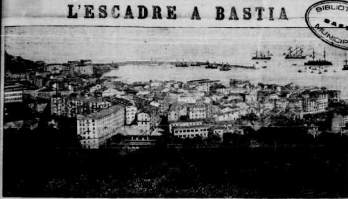
L'ESCADRE A BASTIA

Correspondant spécial, M. JULES BARIOL, 41, rue Fontaine, à Paris ABONNEMENT (Payable d'avance) Un an, 20 fr. 6 mois, 10 fr. — Un mois, 1 fr. 25 c. Autres Départ. 22 fr. — 12 fr. — 1 fr. 25 c. On se répond pour des manuscrits déposés.