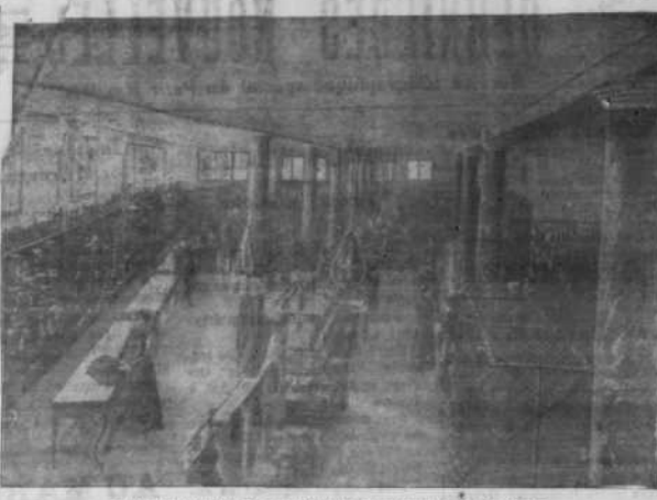
VUE D'UNE DES SALLES DES NOUVEAUX MAGASINS

Maison J. Barbuccia et Fils Porcelaine et Faïence Verrerie et Cristaux Utensiles de ménage Coutellerie et Couverts Articles de Paris Articles de Voyage Breveté et Quinquina Bijoux et Ameublement Parapluies, Umbrelles et Cannes Brosses, Bouteilles, Passanterie Meubles pour chapeaux