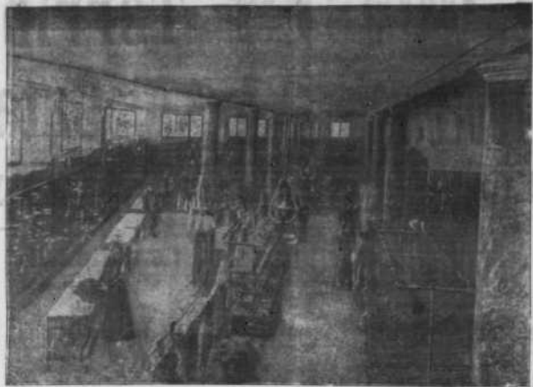
VUE D'UNE DES SALLES DES NOUVEAUX MAGASINS

Ne pas quitter Bastia, sans venir visiter cette installation, la seule du genre en Corse.