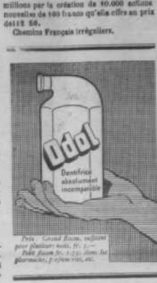
Dédé Démontre absolument l'inefficacité de tout autre remède.