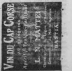
VIN DU CAP CORSE

UN EMPRUNT de 7 milliards de dollars. Toute l'activité du Gouvernement est tournée vers la Guerre. De nombreux projets de loi sont soumis au Congrès; entre autres le