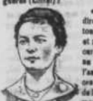
M. le sous-lieutenant...

Le ministère de l'Agriculture publie les renseignements suivants sur la situation agricole dans le département de la Corse, d'après le rapport du D. vicier départementale :