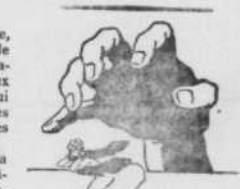
Il est inutile de courir, le malade si vous êtes atteint, une grande quantité de vitamines et un grand dépenseur sur vous. Pour régénérer le sang et le rendre plus riche en vitamines, il ne faut pas être DÉBILITÉ, il ne faut pas être DÉBILITÉ, il ne faut pas être DÉBILITÉ.

Je suis particulièrement heureux, si la question que j'ai l'honneur de vous soumettre pourrait faire l'objet d'une décision favorable.