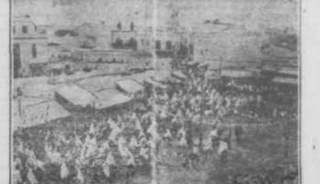
En prévision d'une offensive rifaine dans l'Ouergha, d'importantes renforts ont été dirigés vers cette région. Notre photo représente un contingent de gendarmes s'apprêtant à partir pour le Rif.