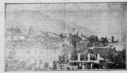
Vue générale de la petite ville Bastia où se traitent actuellement les problèmes si graves dont la solution peut amener la paix définitive.