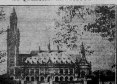
Devant la Cour permanente de Justice internationale, sir Douglas Hogg, représentant le gouvernement anglais, a terminé sa plaidoirie dans la question de Mossoul. Il a conclu que si la Turquie persiste à refuser ses engagements, l'Angleterre est décidée à reprendre sa liberté d'action. Voici le Palais de la Paix à La Haye.