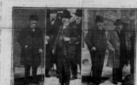
La crise ministérielle bat son plein. L'annonce est grande dans les couloirs de la Chambre et du Sénat. M. Poincaré a accepté de reformer le ministère. Voici quelques instantanés montrant des personnalités politiques en vue. Des photos ont été prises après le Conseil de Cabinet qui précède la démission. On voit de gauche à droite : M. Luchaire, M. Laval, M. Poincaré et M. Boncour.

Le commerce et l'industrie sont les deux autres piliers de la vie. Ils sont les deux autres piliers de la vie. Ils sont les deux autres piliers de la vie.