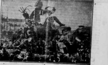
Peu de temps après, les fêtes de Carnaval se déroulent joyeusement à Nice. La cavalcade à parcourir, dimanche, les rues et les places de la ville, au milieu d'une foule considérable. Voici le char de « LA MAJESTÉ CARNAVALE 1923 ».