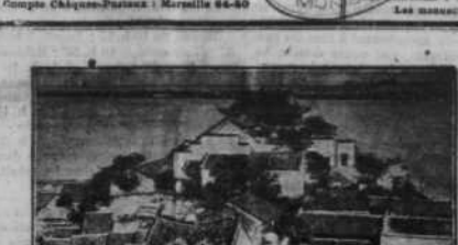
Une vue générale de la ville de Bastia. Au premier plan, la ville de Bastia. Au second plan, la ville de Bastia. Au troisième plan, la ville de Bastia.

L'Allemagne à Genève M. Briand peut considérer avec un légitime orgueil les résultats de la récente campagne qu'il menait de la France, depuis cinq années, à la suite de la signature du traité de Versailles. Il a réussi à faire accepter par la Conférence de la Paix, à la suite de la signature du traité de Versailles, la reconnaissance de la responsabilité de l'Allemagne dans la guerre.