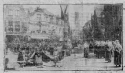
La procession du Saint-Sang à Bruges. On voit à l'arrière-plan le drapeau de la ville de Bruges.