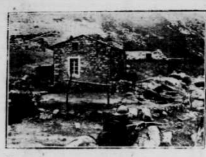
LA MONTAGNE DE SPADA