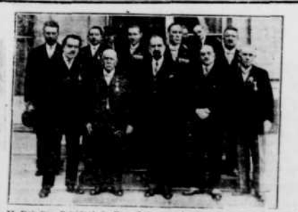
M. Daladier, Président du Conseil, à Paris le 11 mai au Ministère de la Guerre un groupe de militaires ouvriers de France. Sous plume mousseline le délégué des militaires ouvriers de France et certain de M. Daladier.