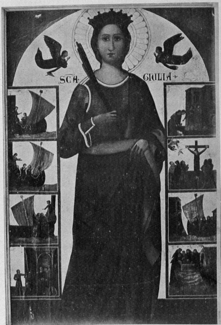
Santa Giulia patrona della Corsica e della città di Livorno

(Quadro a olio del sec. XIII esistente nella Chiesa di S. Giulia in Livorno)